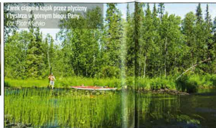
Jarek ciągnie kajak przez pływiczny bystrza w górnym biegu Pany.