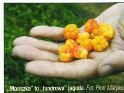
„Moriszka” to „tundrowa” jagoda.