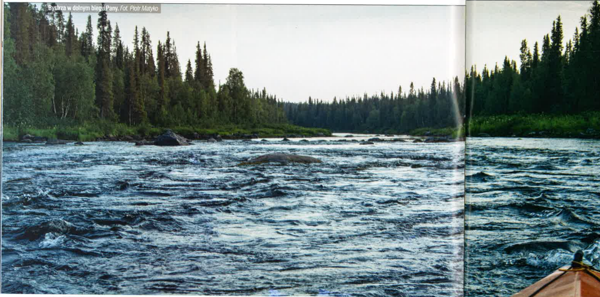
Bystrza w dolnym biegu Pany.

Czy ktoś z Was miałby ochotę mi towarzyszyć? Proszę o kontakt z redakcją WIOSŁA. WIOSŁO