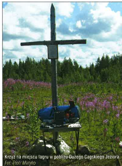
Krzyż na miejscu lagru w pobliżu Dużego Cagskiego Jeziora.