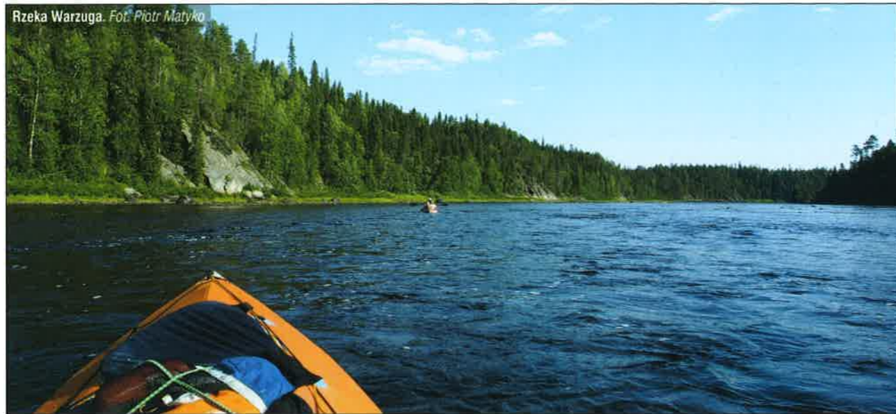
Rzeka Warzuga.